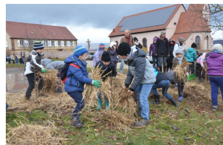
Paillage des plants pour protéger le sol des aléas climatiques et favoriser la reprise des nouvelles plantations