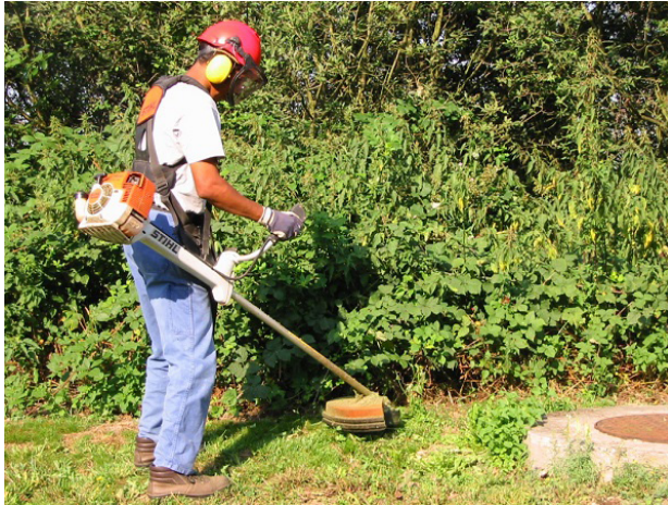
Débroussaillage - La Main Verte

Solivers est une coopérative d'entreprises inclusives qui cumule 30 ans d'expérience dans l'accessibilité des métiers aux personnes en situation de handicap et à faciliter leur insertion sociale. Pierre Hoerter est à l'origine de cette démarche solidaire centrée sur l'humain.